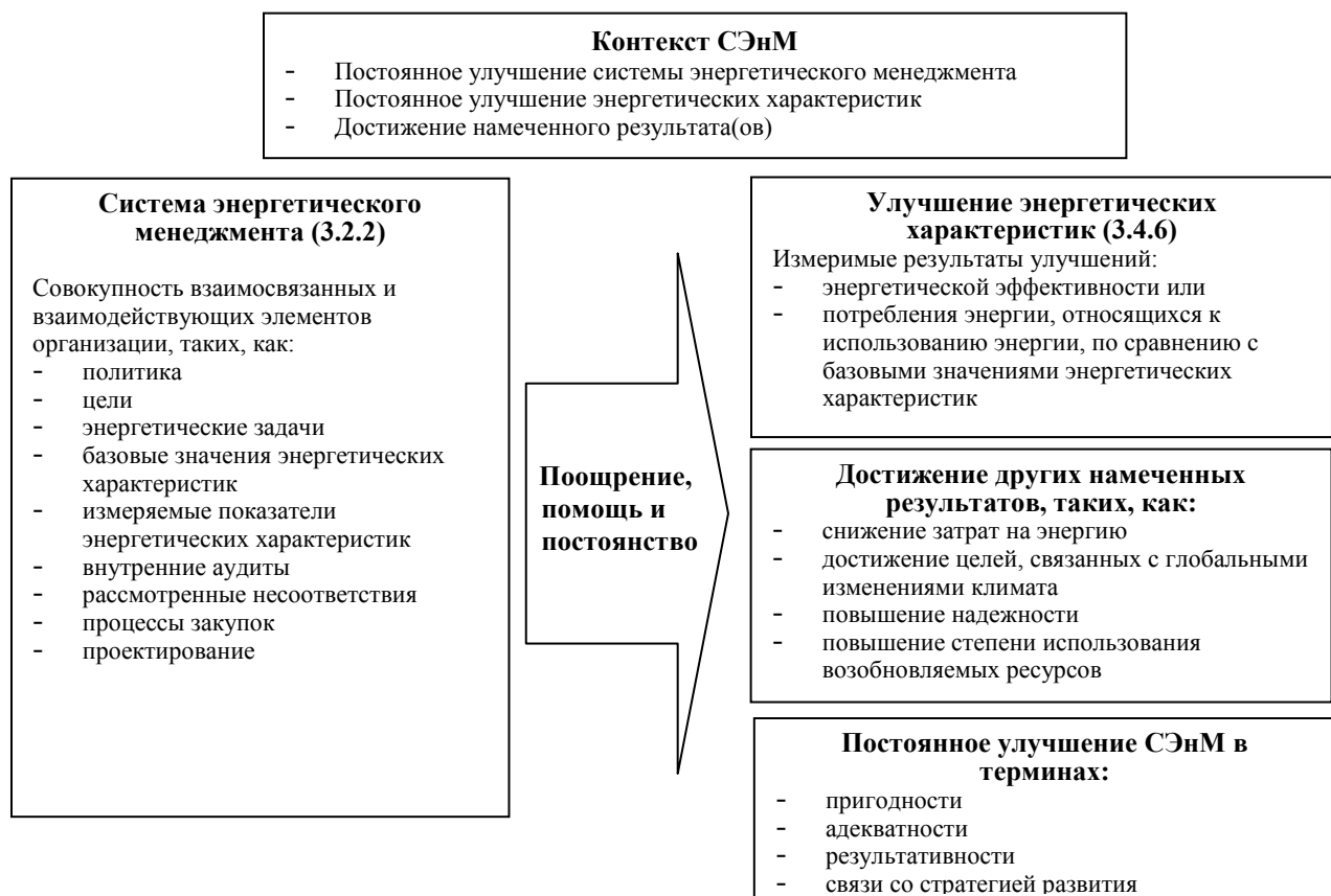
Рис. А.1 Взаимосвязь между энергетическими характеристиками и СЭнМ

Данный документ рассматривает как улучшение энергетических характеристик, так и подход к менеджменту энергии на основе системы менеджмента. СЭнМ использует взаимодействующие элементы, такие, как измеряемые показатели энергетических характеристик и базовые значения энергетических характеристик, в качестве средства для демонстрации измеримого повышения энергетической эффективности или улучшений в потреблении энергии, относящихся к использованию энергии (см. рис. А.1).