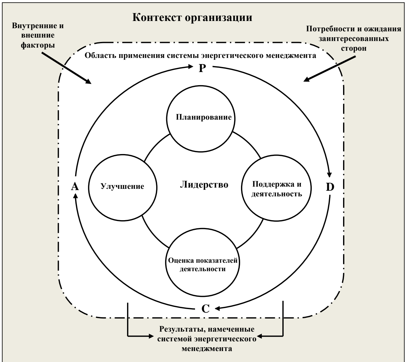
Рис. 1 Цикл PDCA (Plan-Do-Check-Act)